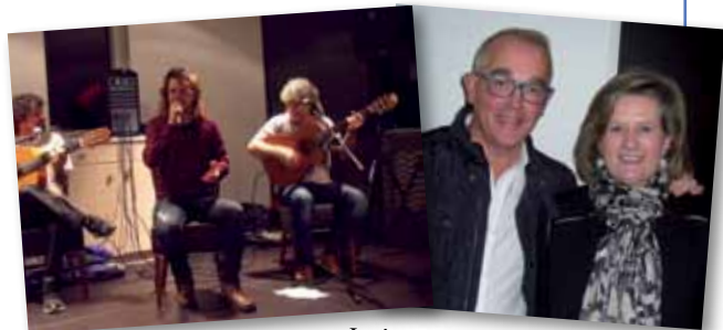
Grupo PA TI NA MÁ.

El Colegio de Ópticos-Optometristas de Galicia celebró el pasado 13 de diciembre la festividad de su patrona, Santa Otilia. Asistieron colegiados de las cuatro provincias gallegas que se reunieron para celebrar este día y disfrutar de una cena-baile en el restaurante Mar de Esteiro en A Sionlla (Santiago). La cena contó con la actua-