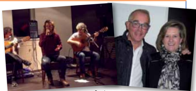
Grupo PA TI NA MÁ.

El Colegio de Ópticos-Optometristas de Galicia celebró el pasado 13 de diciembre la festividad de su patrona, Santa Otilia. Asistieron colegiados de las cuatro provincias gallegas que se reunieron para celebrar este día y disfrutar de una cena-baile en el restaurante Mar de Esteiro en A Sionlla (Santiago). La cena contó con la actua-