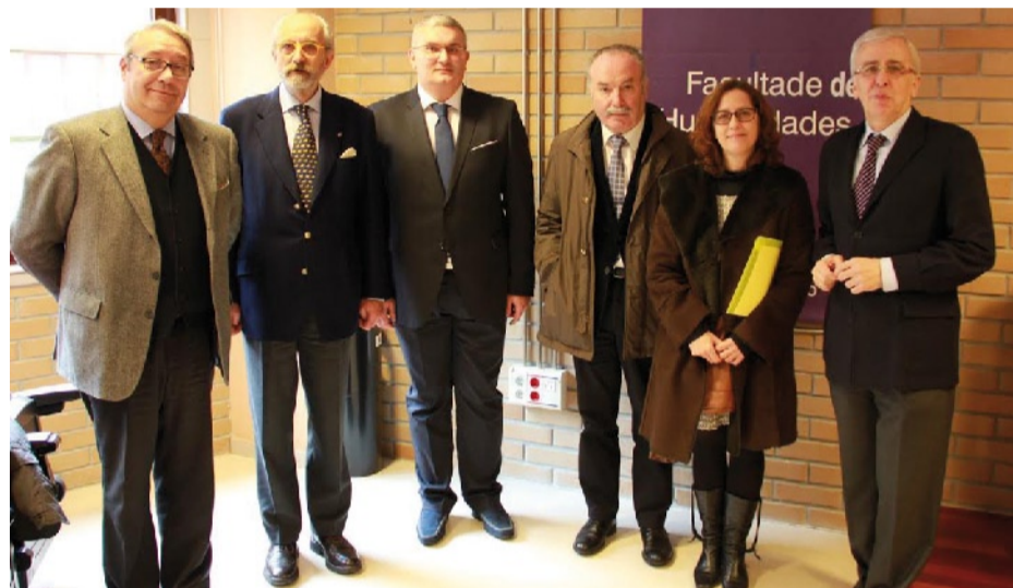
El autor de la tesis, tercero izda., con su director y los miembros del tribunal.