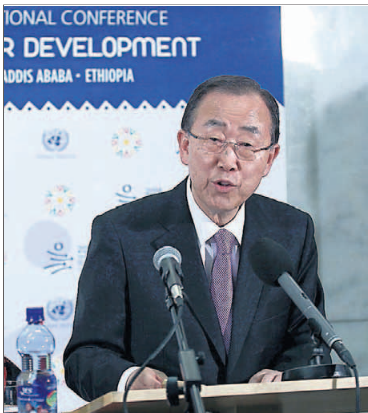
Ban Ki-moon, el lunes en Adis Abeba.

"Hemos detenido y revertido la epidemia en el mundo", aseguró Ban, quien no obstante recordó que el sida "no ha terminado en ninguna parte del mundo", puesto que la epidemia también ha aumentado cerca de un 20% en otros 56 países.