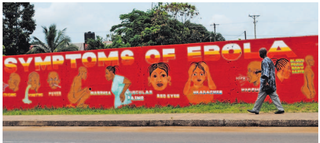
La mayoría de las muertes se producen en Liberia, Guinea Conakry y Sierra Leona. En la foto, un mural en Liberia informa sobre el ébola.

Por otra parte, estos especialistas aconsejan evitar la exposición solar en las horas centrales del día porque, al igual que la piel, los ojos también se resienten. La arena y el agua del mar reflejan la luz un 75 % frente al 10 % que se refleja en el medio urbano por lo que se deben extremar los cuidados en las playas.