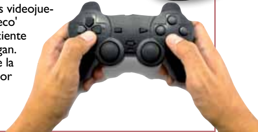
Atlántico Diario (30/09/13)

Un estudio de la Universidad Politécnica de Cataluña (UPC) ha revelado que muchos usuarios de videojuegos, y especialmente de los videojuegos más rápidos, sufren de 'ojo seco' porque no parpadean con la suficiente calidad y frecuencia mientras juegan. El "ojo seco" es una alteración de la superficie ocular que se origina por falta de producción de lágrima o por una lágrima de poca calidad que se evapora rápidamente.