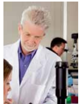
La Voz de Galicia-Santiago (28/11/13)