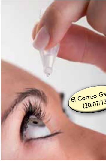
El Correo Gallego (20/07/13)